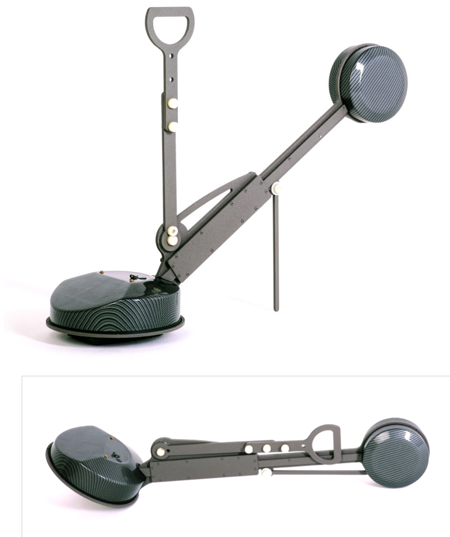
Рис. 1 Геовизер v.3

3.12. Исполнение прибора брызгозащитное, не герметичное.